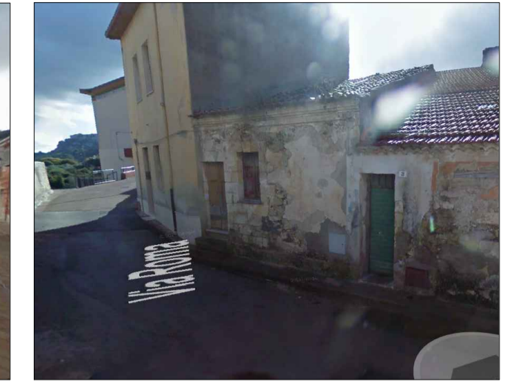
Scheda 12 Comp 10 - Residenza