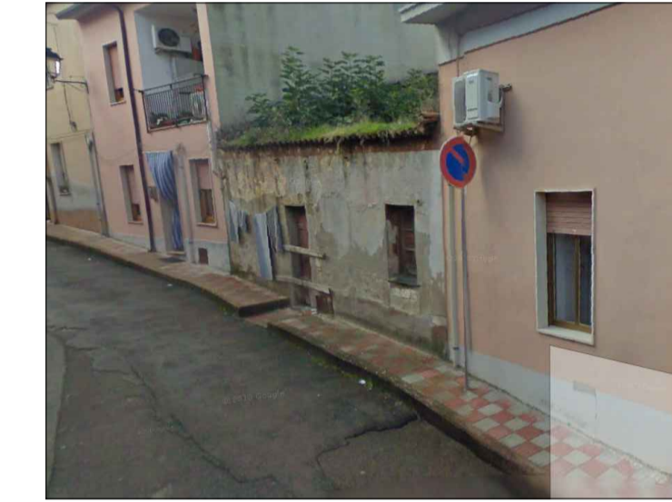
Scheda 6 Comp 8 - Residenza