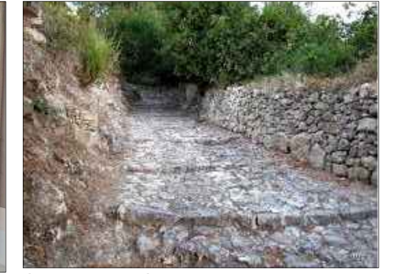
Strada romana "Sos Bajos"