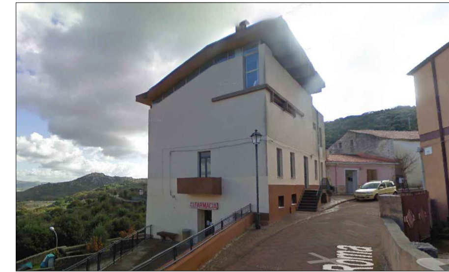
Scheda 1 Comp 13 - Ex Casa Comunale