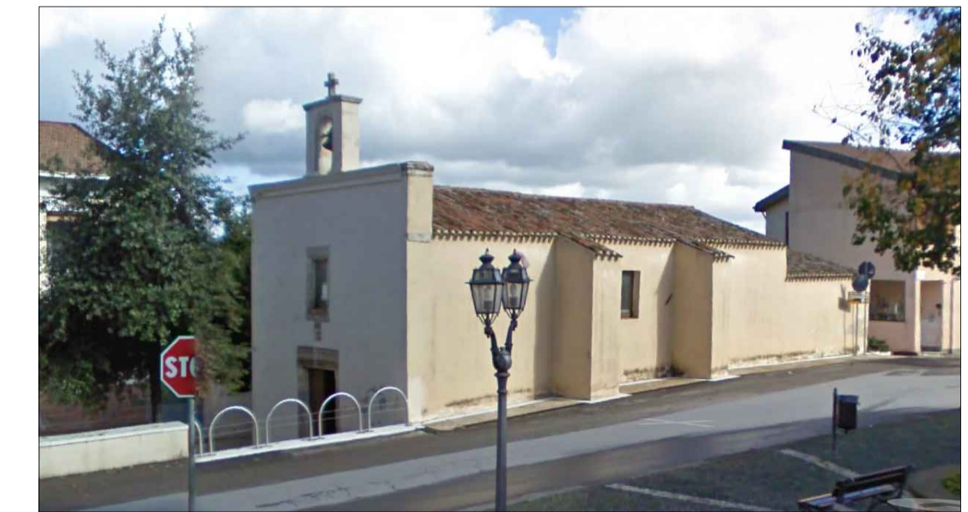
Oratorio Santa Croce