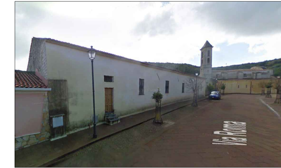
Scheda 3 Comp 13 - Ex Casa Parrocchiale