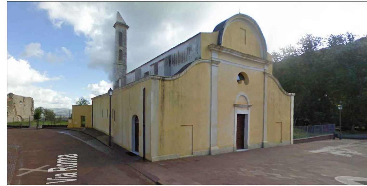
SS. Quirico e Giulitta