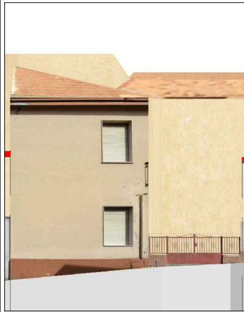
via Nazario Sauro